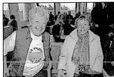
LA BYGDA GÅ I ARV.