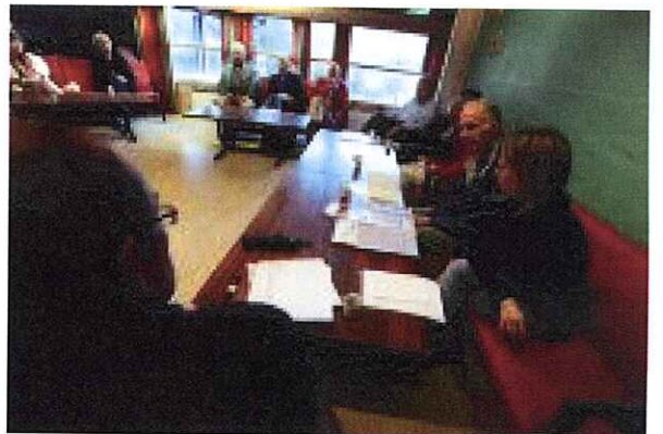
FØRSTE MØTE. 17 nittedøler stilte til første samling. Ifølge lederen ville flere småbarnsforeldre stille, men tidspunktet klokka 18 var et hinder.